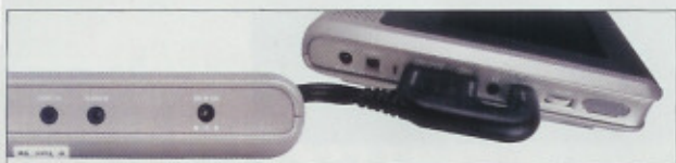
Über ein mitgeliefertes Spezialkabel kann der zweite Monitor direkt vom Hauptgerät mit Strom-, Video- und Audiosignalen versorgt werden

Hauptgerät auch noch eine USB-Schnittstelle, über die unter anderem MP3-Musik oder Bilder in das Gerät gespielt und danach wiedergegeben werden können. Im Test machen beide Bildschirme einen guten Eindruck. Klare und scharfe Bilder zeigen, dass der Hersteller auch bei der Displaywahl eine gute Entscheidung getroffen hat. Ebenso gut ist der DVD-Player des Hauptgerätes, weder mit SVCD noch mit JPEG- oder MP3-Datenträgern treten im Test Probleme auf. Gut zurecht kommt der Player auch mit leichten Stößen, wie sie im Auto bei schlechten Fahrverhältnissen des Öfteren auftreten. Beim Batteriebetrieb setzt Nextbase auf einfache Mignon-Batterien oder Akkus. Diese liegen dem Lieferumfang leider nicht bei. Unsere Akkus hielten im Test annähernd 2,5 Stunden.